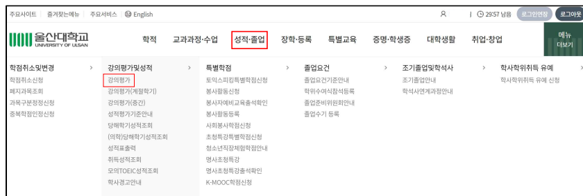
[그림 1-2] 강의평가 프로그램 접속 경로 화면